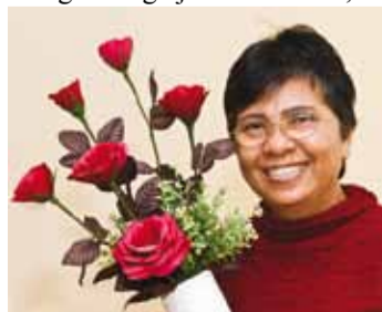
Saiwaroon tillverkar naturtrogna rosor av kaffefilter