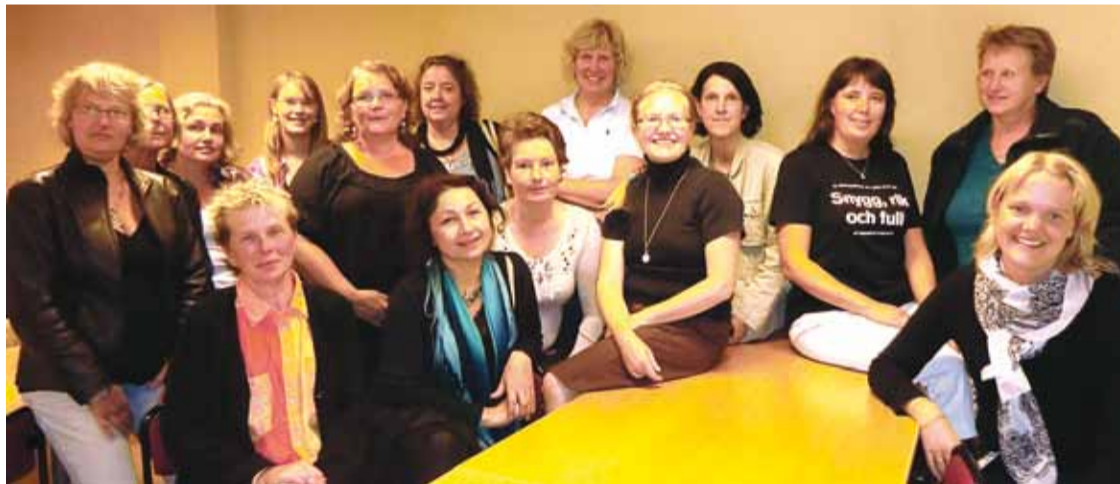
Förväntansfulla företagare på högskolans höstupptakt för kursen Himlarand. Himlarand är landsbygdens glastak. Det osynliga och ouppnådda hindret för kvinnors karriär?

Trots decennier av projekt och särskilda insatser för att stötta kvinnor i att starta och driva företag så händer inte tillräckligt.