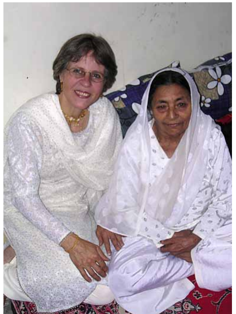
I det goda mötet är båda givare och mottagare

Inom projektet NY.BY - kvinnors entreprenörskap på landsbygden - är du välkommen att delta!