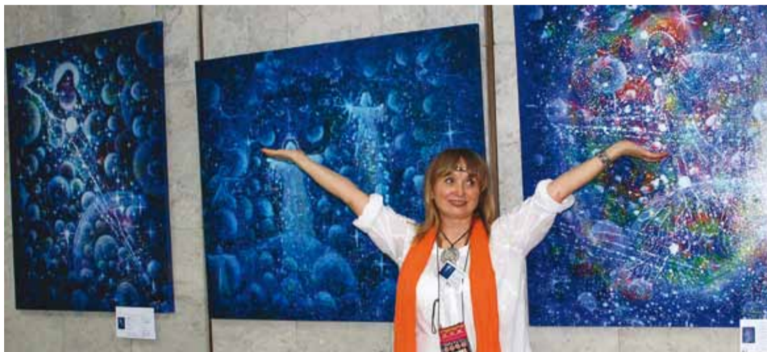
Tanjas utställning i Moskva i juni 2010