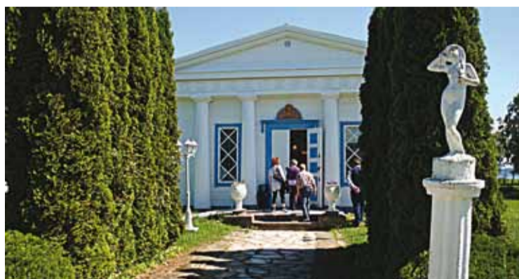
Tempelgården på norra Visingsö

En tidig morgon tisdagen den 15 juni 2010 steg ett gäng förväntansfulla kvinnliga företagare från Eksjö kommun på bussen, med start i Mariannelund, för att tillsammans åka till Visingsö, och under dagen besöka några av de många företagare som finns på ön.