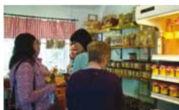
Besök på Svengården