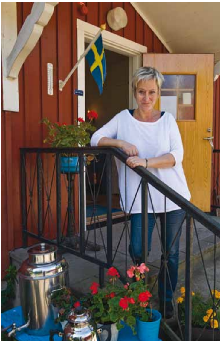
Pittoreskt pensionat med pelargoner