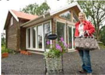
Den gamla drängstugan har blivit ett spa

– Fast frukostbuffén serverar jag alltid nere i grillkåtan, den