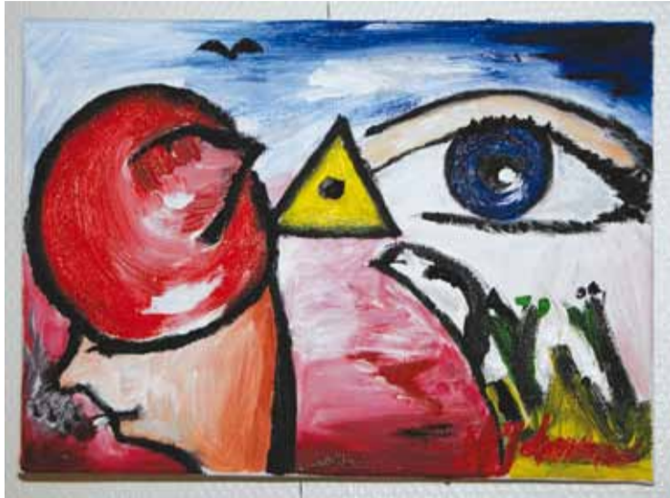
Damen med hatten

Regionalt Resurscentrum för kvinnor, Jönköpings Län