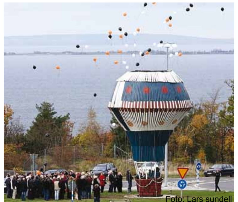
Ballongsläpp vid invigningen 20081018