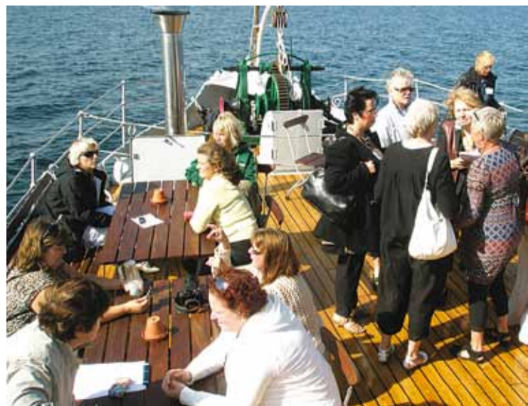
Här nätverkas det i fören

Tack vare finansiering via Tillväxtverket och regionala aktörer, samt eget arbete från resurscentrumens sida så kan du delta i dessa två dagar till mindre än självkostnadspris. Deltagaravgiften är endast 995 kr och täcker då både båt- och bussresa, mat dag 1 och 2 samt övernattnings, förutom möjligheten till nya spännande kontakter och marknadsföring av dig eller ditt företag.