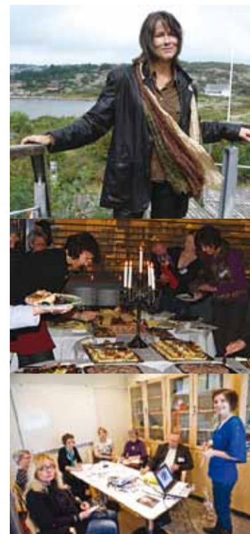
Innovation, Design, Mathantverk Turism och Det goda livet

Häng med på en häftig mässa i Brittsommartid! Finn affärskontakter, nätverka och ha roligt!