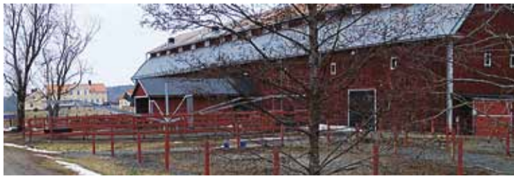
Stallet med motionsanläggning för hästarna på Riddersberg

Enligt Therese vill Riddersberg vara ett hästcentrum som strävar att vara det bästa för