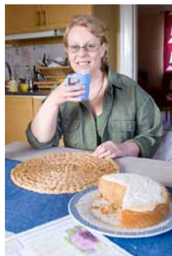
När vattnet står still blir vattnet unket

rädslan. Som när hon valde att lämna jobbet i blomsterbutiken när hon vidareutbildat sig.