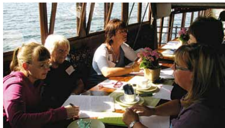
Deltagarna samlas för att diskutera gemensamt intressant ämne

Nytt för 2010 är alltså att det inte enbart blir en båtresa utan också ett bussrally med besök hos företagare. Planeringen pågår för fullt och olika alternativ för rallyts route håller på att gås