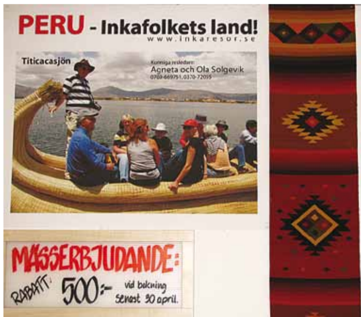
Skytt som används vid deras monter

som fyraåring och lämnade först 21 år senare. Spanskan blev hennes modersmål, hon är fortfarande medborgare i Peru trots att hon idag också är svenska med barn och deltidsjobb.